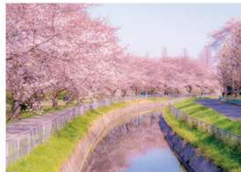
見沼代用水の桜並木