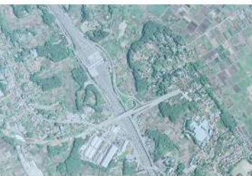
1995(平成7)年の「浦和美園」駅の航空写真

みそのウイングシティの区画整理によって取り壊されましたが、かつては埼玉の北側に「武州鉄道」の橋台がありました。国道122号は、その廃線跡を一部利用して開通したんですよ。