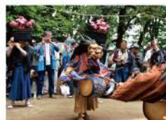
伝統的な「南部領辻の獅子舞」

約1時間の座談会では、サポーターそれぞれがもつ美園へのアツい想いを聞くことができました。新旧住民が力 を合わせることで、『美園人』はさらに地域コミュニティメディアとして強くなります。サポーターが活躍する今後 の『美園人』にぜひご期待ください！